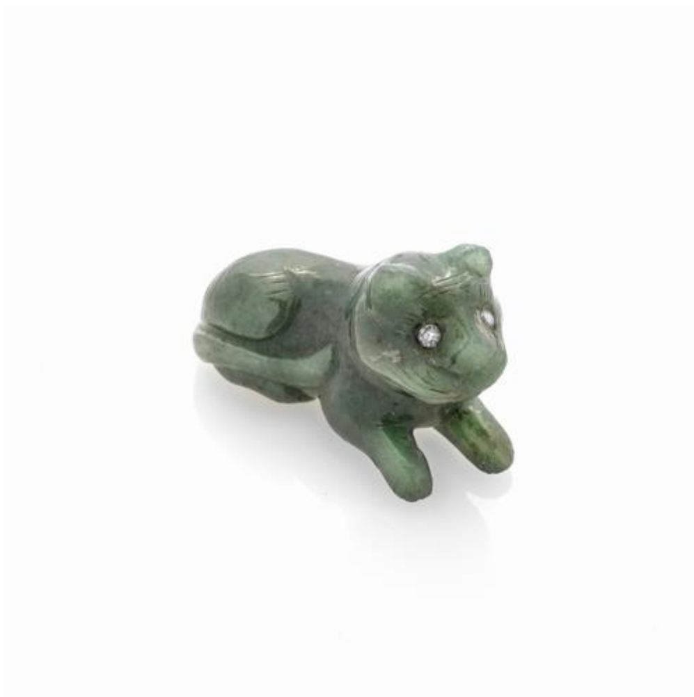
Pantera in aventurina con occhi di diamante taglio brillante, Pantera scolpita con gli occhi con due diamanti taglio vecchio per ct 0.10, gr 37.8