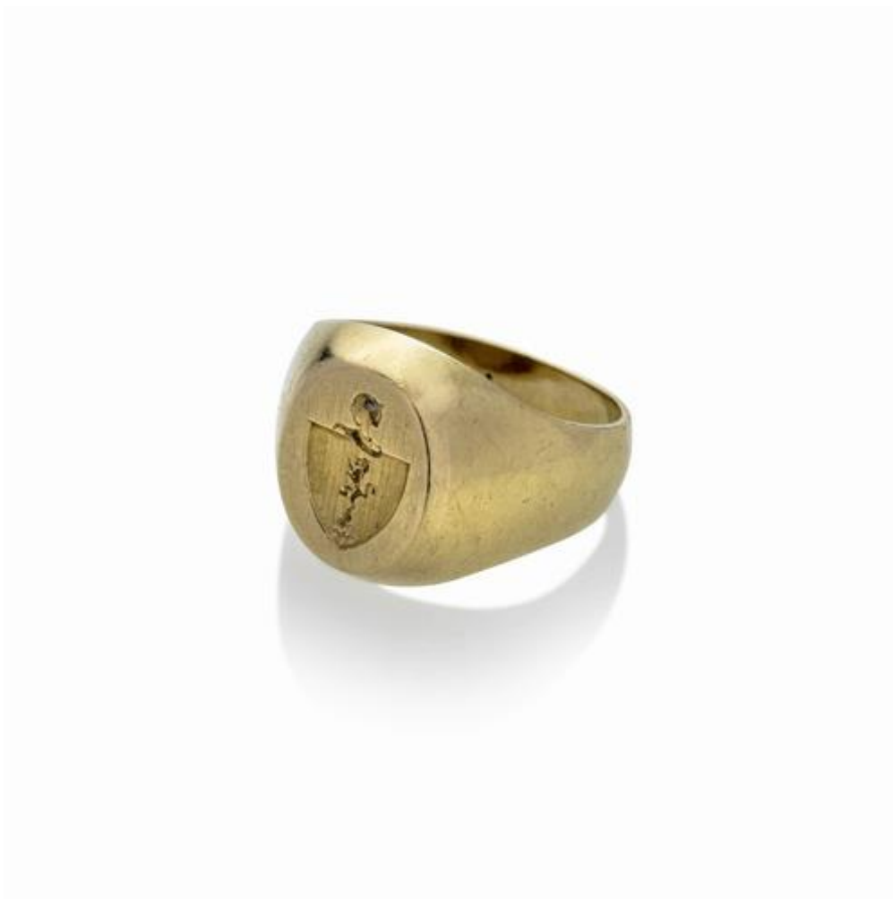
Anello chevalier in oro giallo con stemma nobile inciso, Anello chevalier reca il marchio 750, gr 10.9